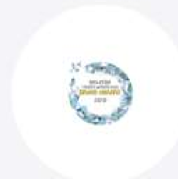
MALAYSIA HEALTH & WELLNESS BRAND AWARDS