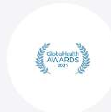
GLOBAL HEALTH AWARDS